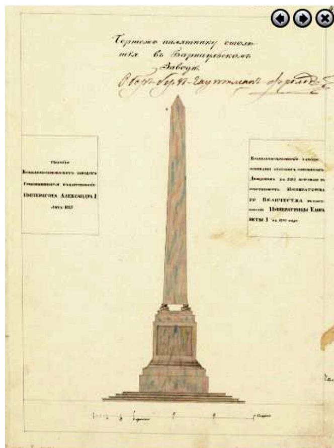
Рис. 1. Рисунок проекта памятника-obeliska в ознаменование 100-летия горного дела на Алтае. 1825 г.

В контексте сооружения обелиска важное место в деятельности Петра Козьмича Фролова занимает реализация проекта организации заводской площади для достойного размещения памятника (сейчас известной как Демидовской). Именно эта площадь, застроенная зданиями в стиле русского классицизма и с поставленным в центре обелиском, по своему облику позже даст визуальное основание образу-метафоре «уголок Петербурга». По сведениям ученого-путешественника К.Ф. Ледебура, во второй половине 1820-х гг. проект площади вполне сложился [24, с. 147].