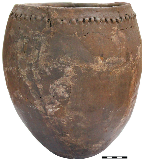
Рис. 2. Керамический сосуд из «селища Суртайка» [АГКМ. ОФ 13187/3-25].

населения [17, рис. 9.-1; 18, рис. 2.-5]. Примечательно, что аналогичный развал сосуда был найден Н.Л. Членовой в насыпи разграбленного ирменского кургана на могильнике Суртайка-I [11, с. 115, рис. 44.-9].