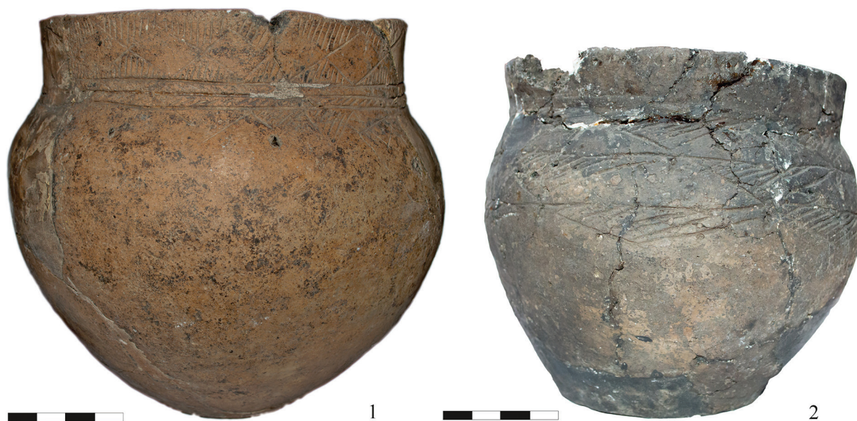
Рис. 1. Керамическая посуда из раскопок памятника Горналь (Герналь) [АГКМ ОФ 13187/1–2].

Второй сосуд склеен из нескольких крупных и мелких фрагментов, составляющих примерно половину изделия, остальная часть была реконструирована [АГКМ ОФ 13187/2]. Предмет имеет несколько более профилированную горшковидную форму, дно плоское, срез венчика прямой (рис. 1.-2). Высота