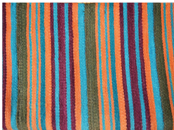
Рис. 3. Фрагмент тканого паласа — буй балаҫ . Конец XX в. Бурзянский район, д. Кильдегулово. Фото автора. 2019 г.

Во время экспедиции в 2019 г. в Бурзянском районе РБ встречались характерные для данного ареала паласы, состоящие из очень узких полосок. В основном для данного предмета подбиралась пряжа из пяти цветов. По ширине эти полоски были разными — от одного до четырех сантиметров. Ткачихи использовали приглушенные цвета: оранжевый, голубой, фиолетовый, зеленый, темно-синий, красный. Как пишет С.Н. Шитова, «черный встречался чаще на юге, красный (малинового оттенка) — на севере Бурзянского района» [3, с. 55]. Во время экспедиции в 1976 г. в д. Бретьяк того же района С.Н. Шитова зафиксировала палас, где на малиново-голубом пестром фоне выделяются фиолетовые и ярко-желтые, зеленые полосы. Густой малиновый цвет заменил популярный некогда красный (рис. 3). Среди разных по ширине полос выделяются линии из зубцов, состоящие из желто-голубых нитей [3, с. 56].