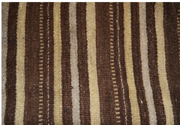
Рис. 4. Фрагмент буй балаc из натуральной пряжи. Аскарковский историко-краеведческий музей. Начало XX в. 2019 г.

В Абзелиловском районе до середины XX в. прочно держалась традиция изготовления паласов из коричневой овечьей и козьей шерсти, а иногда покрашенной в черный цвет. В фондах Аскарковского историко-краеведческого музея хранятся несколько таких экспонатов: здесь для фона использовали более естественные тона — черный, коричневый цвета, где полосы из натуральных цветов — белые, серые (рис. 4.). Встречаются сотканые паласы, где на черном фоне расположены разной толщины (от одного до трех сантиметров) розовые, желтые полосы. В фондах музея хранятся экспонаты, где в качестве фона использованы оранжевый и розовый, а полосы — из натурального черного, белого, коричневого цветов. Во всех музейных тканых паласах присутствуют линии из зубцов разной ширины [7].