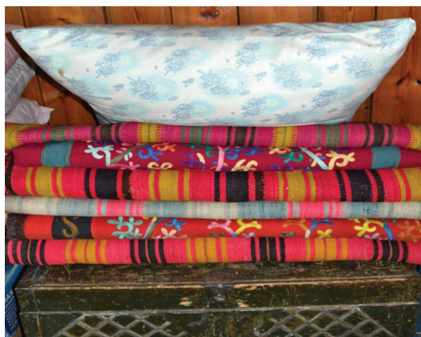
Рис. 1. Тканые паласы — буй балаҫ . Белорецкий район, с. Узянбаш. 2013 г.

В Белорецком районе (Инзерский бассейн) в начале XX в. темный (естественный) цвет шерсти доминировал, служил фоном для узких ярких полосок (красного, желтого). Во второй половине XX в. распространились многоцветные паласы. Использовалась красная, желтая, оранжевая, зеленая, синяя пряжа. Каждому населенному пункту был свойствен набор определенных цветов (рис. 1, 2) Во многих населенных пунктах красный цвет становился фоном для желтых, оранжевых и темно-синих полосок [7].