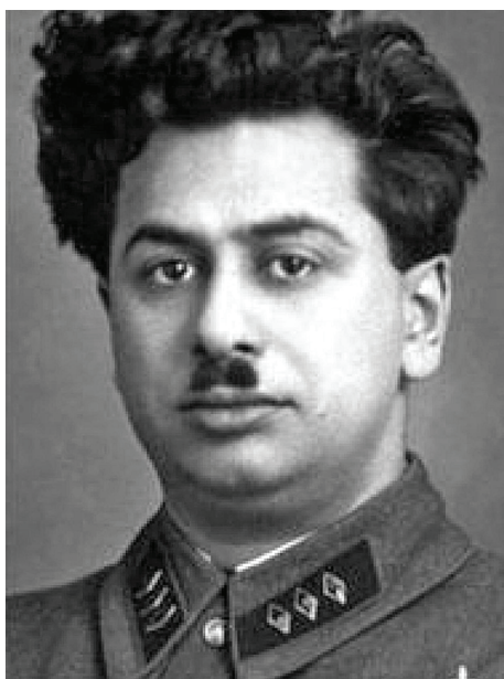
Рис. 6. Генрих Люшков

Особняк пережил революционные потрясения, и в 30-е гг. НКВД устроил здесь спецшколу [3]. Ее посещал замнаркома НКВД Генрих Люшков (самый высокопоставленный перебежчик) перед тем, как «уйти» в Японию в 1938 г. Информация, которую он передал японским спецслужбам, была бесценна: дислокация советских войск, военные шифры, информация о группе Зорге и т.д. Японцы застрелили Люшкова 19 августа 1945 г. после вступления советских войск в Маньчжурию [4, с. 92].