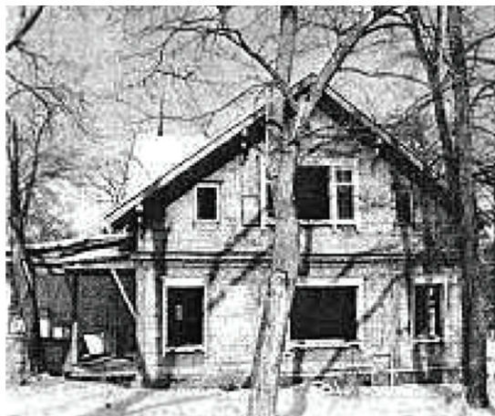
Рис. 1. Бывшая дача Бринеров на станции Санаторная

Этот двухэтажный деревянный особняк в лесном пригороде Владивостока (станция Санаторная) разрушается, брошенный на произвол судьбы как старый больной бомж, за плечами которого жизнь, наполненная событиями, населенная яркими персонажами, сыгравшими в прямом и переносном смысле значительные роли в мировой культурной и политической жизни. Дом был построен приморским олигархом Борисом Бринером и использовался в качестве дачи. Его отец Жюль Бринер (выходец из Швейцарии) в 1902 г. продал царскому правительству лесную концессию в верховьях пограничной реки Ялу, что было использовано Японией в качестве одного из поводов для развязывания войны против России (1904–1905 гг.) [1, с. 431].