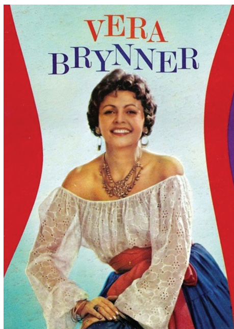
Рис. 5. Вера Бриннер (родная сестра Юла Бриннера), солистка Метрополитен опера

Особняк пережил революционные потрясения, и в 30-е гг. НКВД устроил здесь спецшколу [3]. Ее посещал замнаркома НКВД Генрих Люшков (самый высокопоставленный перебежчик) перед тем, как «уйти» в Японию в 1938 г. Информация, которую он передал японским спецслужбам, была бесценна: дислокация советских войск, военные шифры, информация о группе Зорге и т.д. Японцы застрелили Люшкова 19 августа 1945 г. после вступления советских войск в Маньчжурию [4, с. 92].