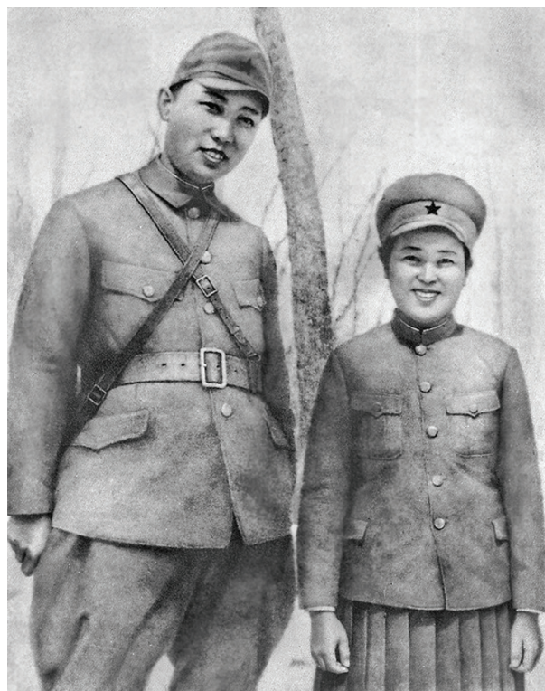
Рис. 7. Ким Ир Сен во время пребывания в СССР. Справа его первая жена (партизанка) Ким Чжон Сук (1942 г.)

В 1942 г. в этом «учебном заведении» осваивал тонкости диверсионно-разведывательной работы молодой корейский партизан Ким Сон чжу, в 1946 г. ставший известным всему миру как Ким Ир Сен — лидер Северной Кореи. Впервые я узнал об этом в конце 1970-х гг., работая над диссертацией о борьбе корейцев за независимость (в том числе о партизанской борьбе Ким Ир Сена), наткнувшись в «Ленинке» на серьезный японский источник, согласно которому в 1942 г. Ким Ир Сена видели (японские агенты) в районе станции Санаторной [5, с. 76–78]. Я посмеялся над этим вымыслом. Ведь шпионская сеть к этому времени была ликвидирована (в то время я верил в эти сказки). Кроме того, Ким Ир Сен в начале 40-х гг. был командиром партизанского отряда в Маньчжурии [6]. И найти средней руки партизанского лидера на бескрайних просторах СССР было гораздо сложнее, чем пресловутую иголку в стоге сена.