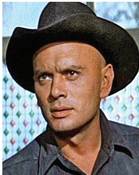
Рис. 4. Юл Бриннер в роли Криса Адамса («Великолепная семерка»)

Дом помнит озорного мальчугана Юлия (Юла), внука основателя династии, который стал любимцем зрителей послевоенного кинематографа, всемирно известным актером Юлом Бриннером, американским актером Робин Гудом из знаменитого вестерна «Великолепная семерка», за чьими подвигами на экране с замиранием сердца следили миллионы советских людей в 1960-е гг.