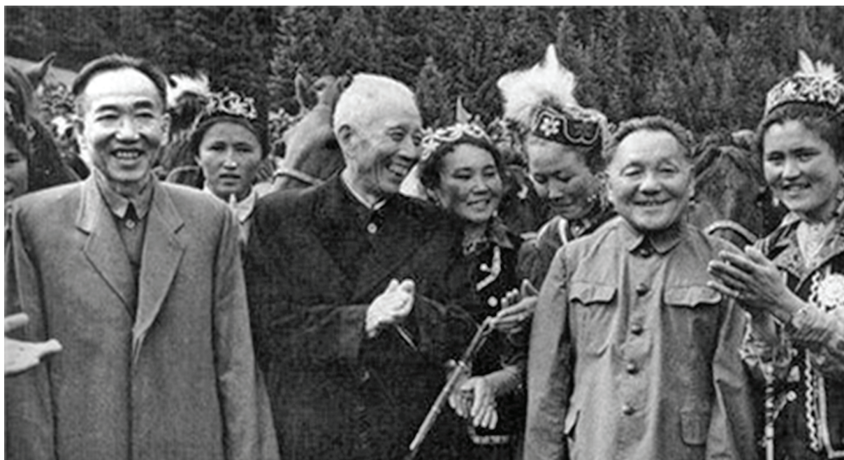
Рис. 3. Ван Жэньчжун, Ван Чжэнь и Дэн Сяопин во время инспекции Синьцзяна 1981 г. [1]

Ван Чжэнь, исследовав ситуацию в Синьцзяне, представил ее в записке 30 июня 1981 г., адресованной Дэн Сяопину. В ней, делая упор на анализе проблем выполнения решения государства о сокращении армейского контингента в Синьцзяне, было выдвинуто предложение восстановить СПСК. 1 июля Дэн Сяопин написал в ответ: «Пожалуйста, предложите товарищу Ван Чжэню взять на себя инициативу собрать товарищей из соответствующих департаментов и руководителей, чтобы сделать систематический отчет о необходимости восстановления СПСК и подготовить проект резолюции [23, с. 3].