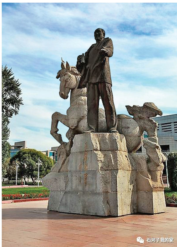
Рис. 4. Памятник Ван Чжэню в г. Шихэцзы

Делая промежуточные выводы о роли возрождения СПСК, хотелось бы подчеркнуть, что последующие годы показали не только восстановление региональной экономики и ее активный рост, доля СПКС в ВВП Синьцзяна была весомой. Деятельность корпуса вместе другими мероприятиями смогли на время решить национальные противоречия и стабильно установить китайский контроль над регионом. Пожалуй, самое главное, на что следовало обратить внимание, что СПСК стал основной точкой роста региона, главным актором по реорганизации его экономического и административного пространства.