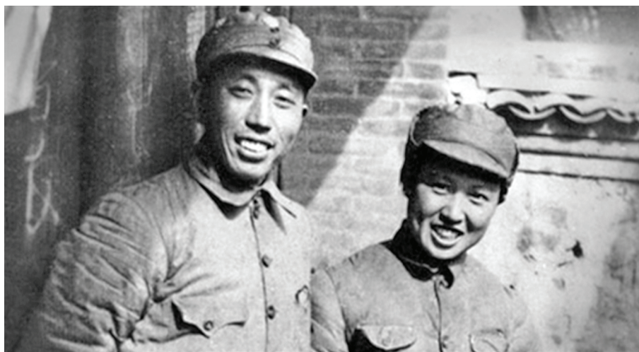
Рис. 1. Ван Чжэнь и его жена Ван Цзицин на антияпонской базе Янбэй, 1938 г. [14]

Родился Ван Чжэнь в апреле 1908 г. в одной из деревень уезда Люян (Хунань). В 14 лет он связывает свою судьбу с молодежным крылом коммунистической партии. После 1927 г. активно борется против гоминдановского правительства, а позже и против японских войск. Благодаря своим воинским талантам он дослужился до командующего армией. Для нашей темы интерес представляет тот эпизод в его военной биографии, который был связан с зачисткой Синьцзяна от гоминдановских войск в 1949 г. Эту задачу Ван Чжэнь успешно выполнил, «мирно освободив» Западный край Китая [14].