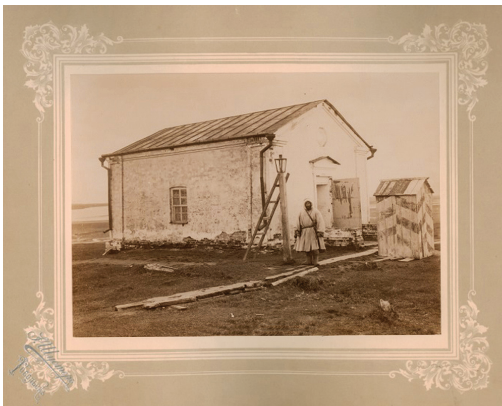
Рис. 4. Часовой у кладовой казначейства в Березове. 1900-е гг.