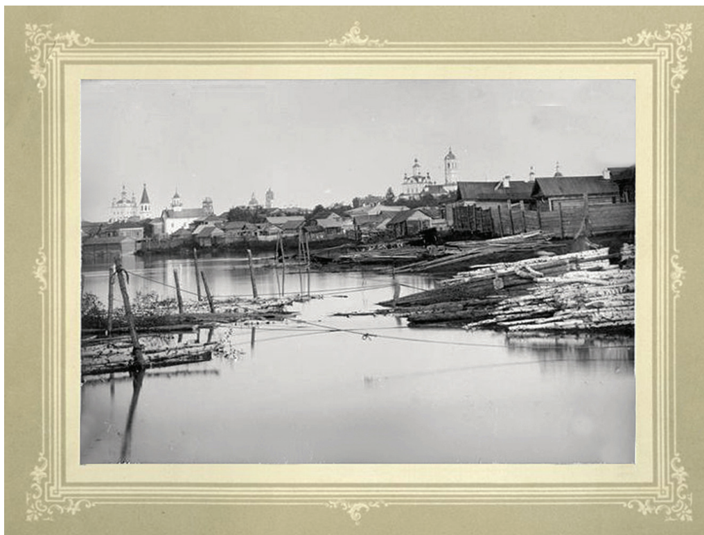
Рис. 2. Вид с пристани на город Тару Тобольской губернии. 1908 г.

В фондах Тобольского историко-архитектурного музея-заповедника хранится коллекция фотографий П.П. Сухих с видами города Тары (рис. 2) [9].