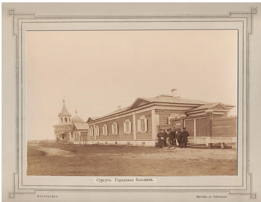
Рис. 3. Сургутская городская больница. Конец XIX — начало XX в.