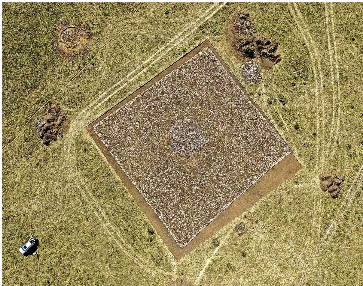
Рис. 3. Вид сооружения 1 после проведения реставрации

Подобная по устройству ритуально-погребальная конструкция выявлена в Восточном Казахстане на могильнике Кырыкунгир [1]. Она имеет подквадратную форму размерами около 20 м. Внешняя сторона каменной ограды также тщательно подработана и отточена до гладкой поверхности. Показательно, что по четырем