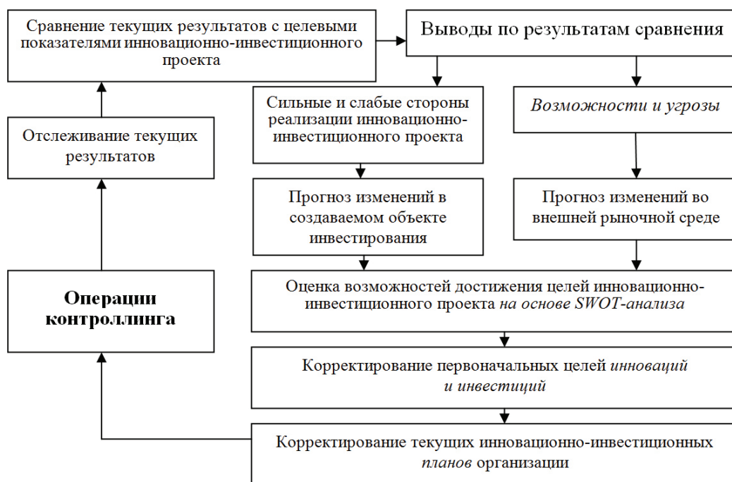
Рис. 1. Схема контроллинговых операций инвестиционно-инновационной деятельности организации